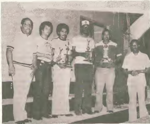
Ganadornan Deporte Intergubernamental